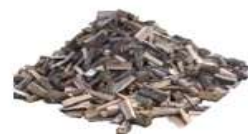
30 - 50cm halupuud