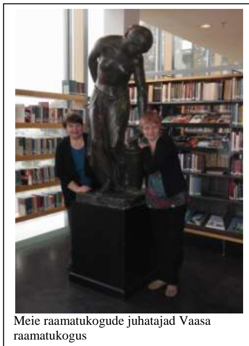
Meie raamatukogude juhatajad Vaasa raamatukogus

Kolmandal päeval külastasime Turu linna ja Turu linnaraamatukogu. Seal oli meie giidiks eestlane, kunagine Pärnu Keskraamatukogu töötaja. Teggu oli inimesega, kes juba 20 aastat on elanud Soomes ja seal raamatukogus head karjääri teinud. Turu raamatukogus on külastusi 4500 inimest päevas, üritused iga päev ja külastajate arv pidevas kasvamas. Raamatukogus hoiul 1 milj raamatut, 2 milj külastust/aastas, 3 milj laenutust/aastas.