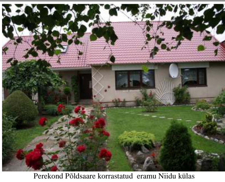
Perekond Põldsaare korratatud eramu Niidu külas