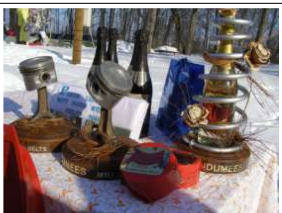
Auhinnalauda