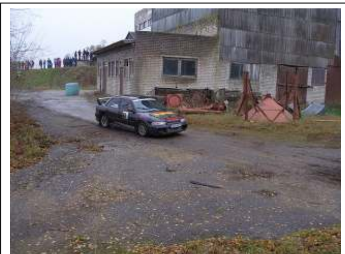
Ain Kastan Mitsubishi Lanceril EVO 3, Suigu kuivatite territooriumil.

2 wd suurte klassis sõitis BMW 325 kaasa Vändra võidusõitja Alo Pöder koos kaardilugeja Ranno Randmaaga , saavutades omas klassis 9. koha, kokkuvõttes 27. koha.