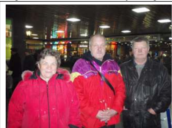
Koos venna ja vennanaisega Peterburi vaksalis

Enne Moskvasse sõitu tehti mõned võtted Pärnus ning 21. oktoobril istus ta Tallinn-Moskva rongile. Moskvas oli vastas saatja sildiga Zdi