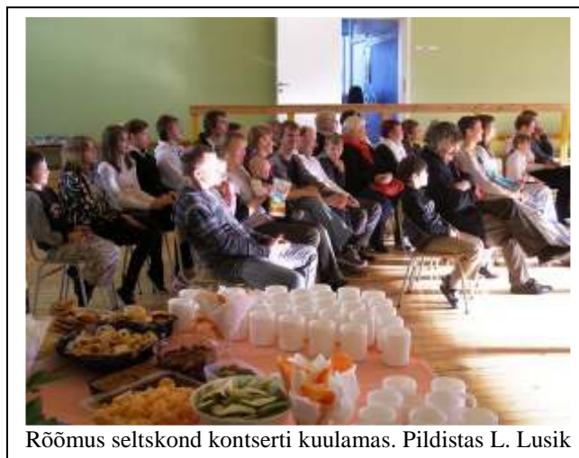
Röömus seltskond kontserti kuulamas.

Nagu oli kavas kirjas, toimus ka lastevanemate üldkoosolek, millest osavõtt jääb järjest kesisemaks. Siit palve lastevanematele - olge usinamad osavõtmaks koosolekutest. Kui algklassides te suhtlete palju klassijuhatajaga ja tunnete suurt huvi oma võsukese õppimise pärast, siis tegelikult tahaks klassijuhatajad vanemate abi just suuremates klassides. Õppealajuhataja rääkis palju laste õppimisest vanemates klassides. Tihti peale tullakse kooli õppimata, koolivahendid puudu ja täiesti magamata. Veerandi lõpus üritatakse kaotatud tagasi teha, kuid mõnel see ei õnnestu ja nii need puudulikud hindid tulevadki. Olen ise nii mõnegi lastevanema käest kuulnud, kuidas õpetaja kiusab ja ei luba kahtesid järele