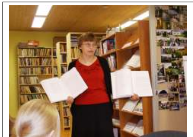
Suigu raamatukogu juhataja tutvustamas raamatukogu ajalugu.

Ja ka kingituseks toodud raamat on riulis esimest laenuajat ootamas.